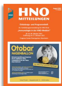
Einladungs- & Programmheft